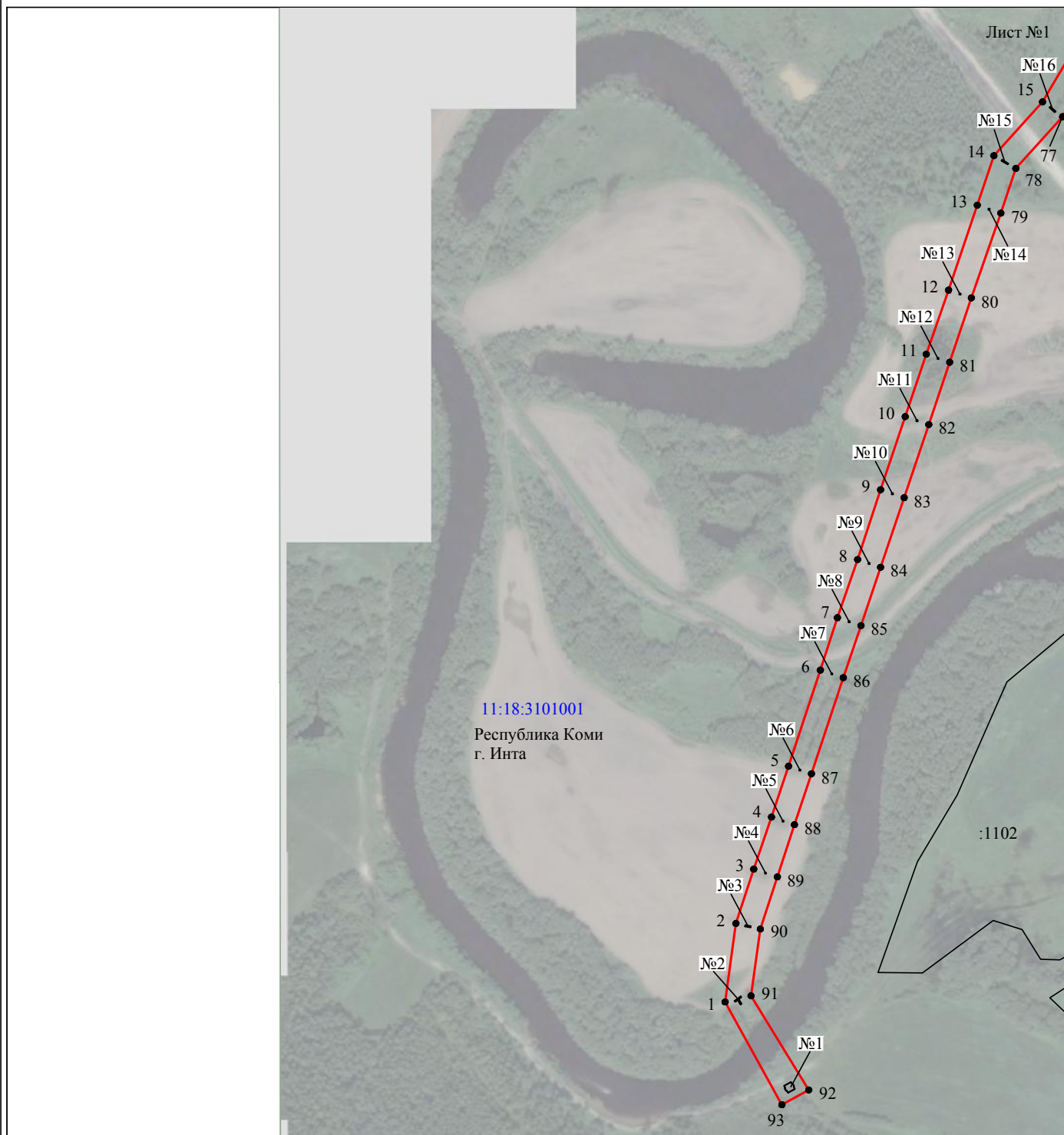
Схема расположения границ публичного сервитута объекта